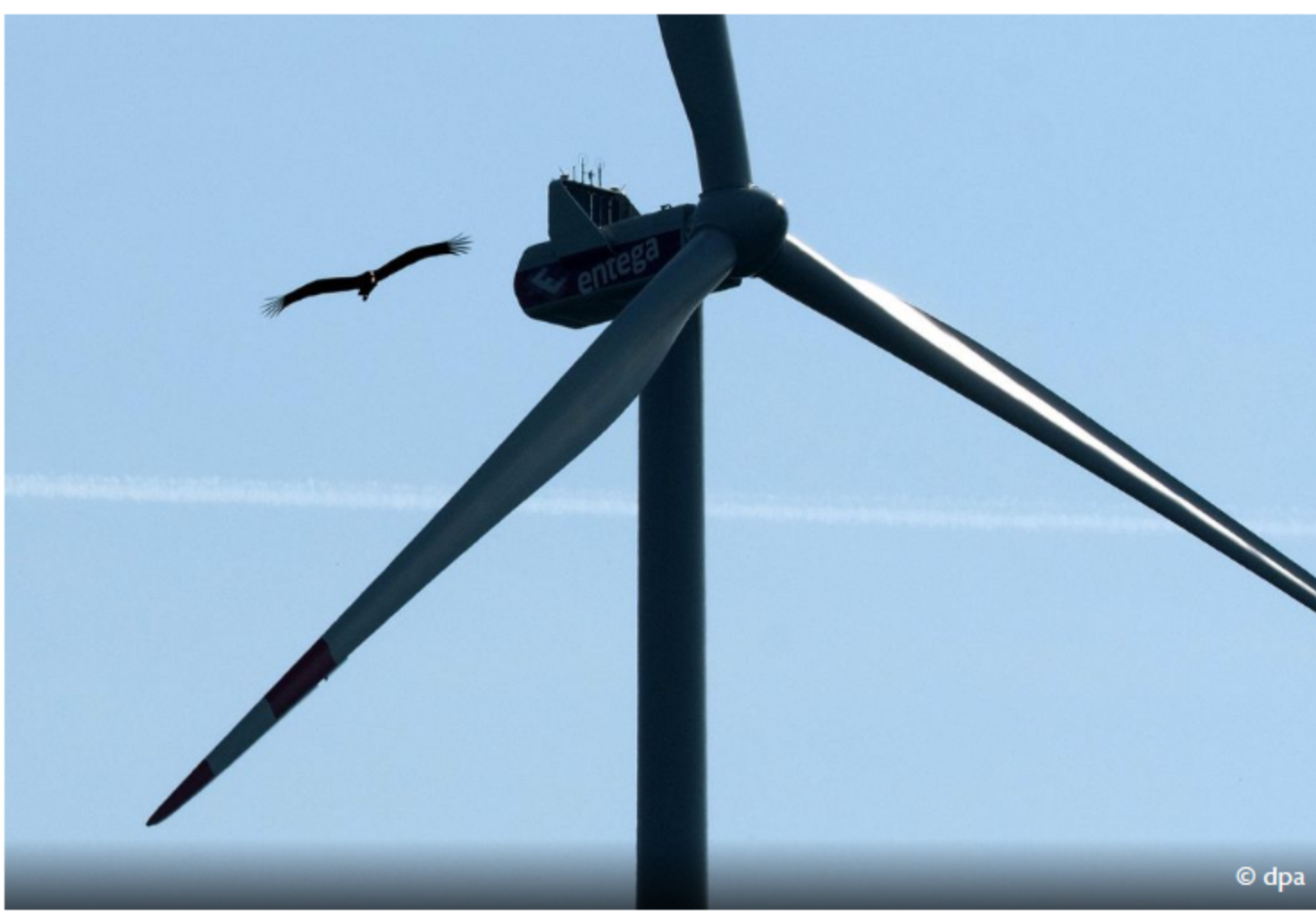
Leidiges Thema: Windkraft in Südhessen, das will nicht so recht passen.

htr. WIESBADEN. Der südhessische Teilregionalplan für erneuerbare Energien wird, anders als geplant, in diesem Jahr nicht mehr verabschiedet. Nach der Berichterstattung dieser Zeitung über gravierende Fehler und Ungereimtheiten in dem Entwurf des Regierungspräsidiums für Südhessen sieht sich nun auch die SPD-Fraktion in der Regionalversammlung nicht in der Lage, die Vorlage zu behandeln. In der dafür vorgesehenen Sitzung des Ausschusses für Umwelt, Energie und Klima werde man Regierungspräsidentin Brigitte Lindscheid (Die Grünen) bitten, „die Vorlage zu überarbeiten“, kündigte Fraktionschef Harald Schindler gestern an. Damit machen die Sozialdemokraten sich die Haltung der Unionsfraktion zu eigen, mit der sie über die Mehrheit in der Regionalversammlung verfügen. Die CDU hatte den Entwurf schon am Montag als „nicht beratungsfähig“ bezeichnet.